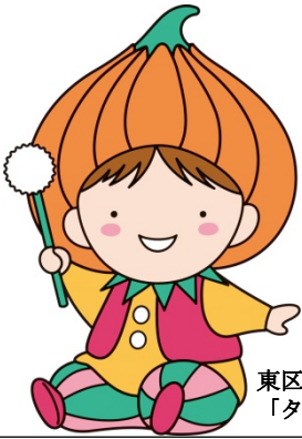
東区マスコットキャラクター 「タッピー」